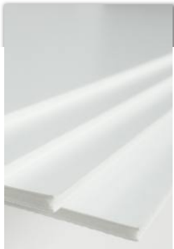
KAPA-Line 3,0 - 5,0 mm