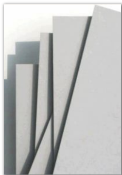
Graukarton 0,5 - 1,0 mm