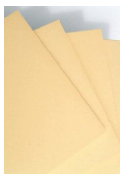
Finnische Holzpappe 1,0 - 3,0 mm