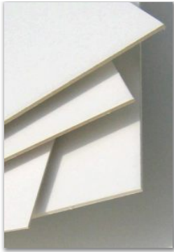
CHROMO-Pappe 1,0 - 2,0 mm